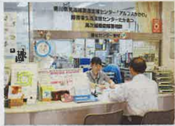
▲来所・訪問など、相談は平日の 午前9時～午後5時(予約制)

発達障害のある本人とその家族、関係機関を対象に、精神科医師、小児科医師、言語聴覚士、心理士、社会福祉士などの専門家がサポート。就労や進学、家庭での対応についてアドバイスしたり、職場の上司からの相談を受けたり、企業に出向いて、困り事を解決できるように導いたり、個々のケースに応じて丁寧に対応してもらえます。研修会の開催、講師の派遣、保育所や学校への訪問など、地道な活動で、地域への理解を深めています。